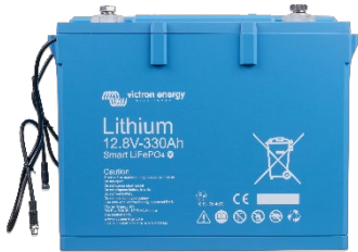
Batería LiFePO4 de 12,8 V 330Ah