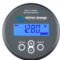
Detección de Bluetooth: BMV-712 Smart Battery Monitor