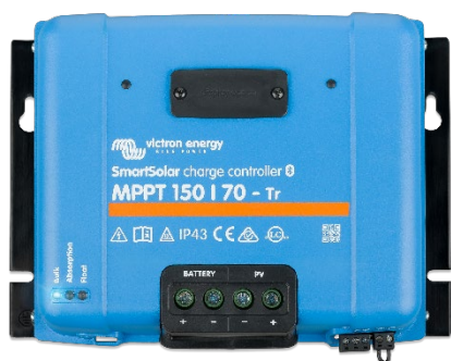
Controlador de carga SmartSolar MPPT 150/70-Tr sin pantalla conectable opcional.