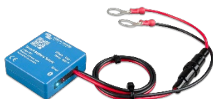
Detección de Bluetooth: Smart Battery Sense