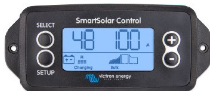
Pantalla enchufable SmartSolar

Simplemente retire el protector de goma del enchufe de la parte frontal del controlador y conecte la pantalla.