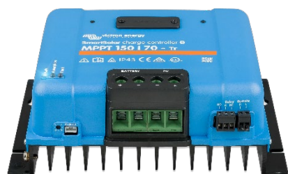
Controlador de carga SmartSolar MPPT 150/70-Tr sin pantalla