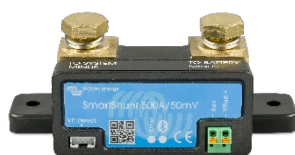
Sensor Bluetooth: SmartShunt