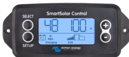
Pantalla conectable SmartSolar