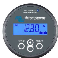
Sensor Bluetooth: Monitor de baterías BMV-712 Smart