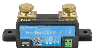
Detección Bluetooth: SmartShunt