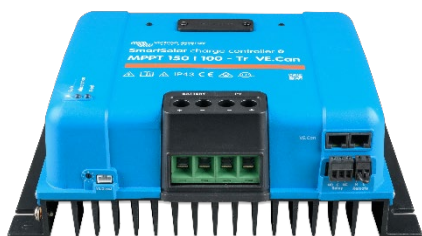
Controlador de carga SmartSolar MPPT 150/100-Tr-VE.Can sin pantalla