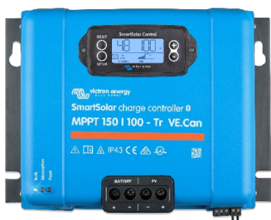
Controlador de carga SmartSolar MPPT 150/100-Tr-VE.Can con pantalla conectable opcional